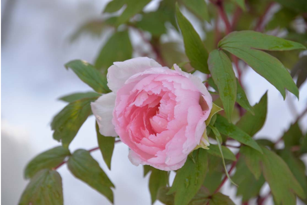
交流活动〈照片讲座〉的作品「冬牡丹」(交流活動写真講座の作品)