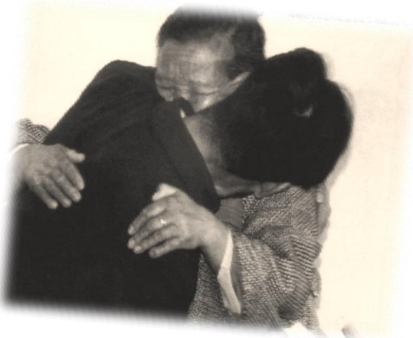
母親と抱きあう周さん