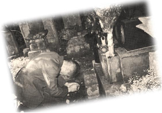
お父さん帰りました。と報告する高さん